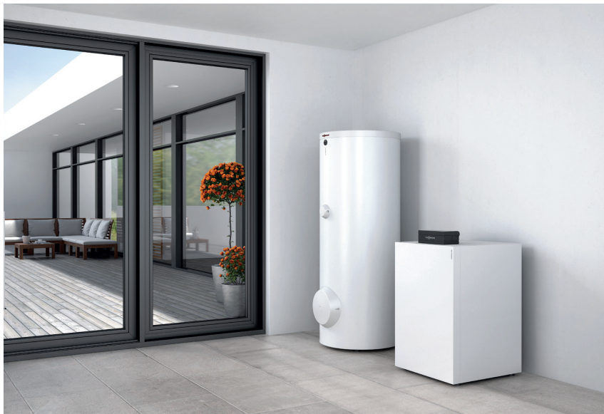
Pompe à chaleur Vitocal 300-G avec ballon d'eau chaude sanitaire Vitocell 100-W (à gauche)

Grâce à la technologie Inverter, la pompe à chaleur eau glycolée / eau Vitocal 300-G est la solution la plus efficace pour les constructions neuves et un choix pertinent dans la rénovation